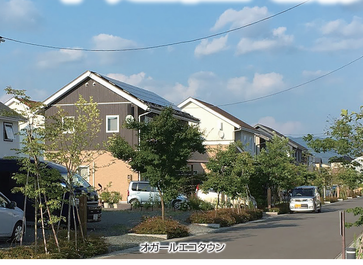
オガールエコタウン