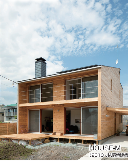
HOUSE-M (2013 JIA環境建築賞 住宅部門 最優秀賞受賞)